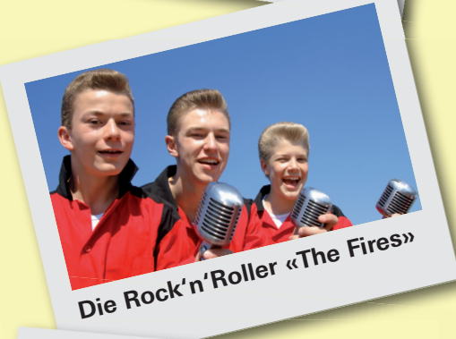
Die Rock'n'Roller «The Fires»