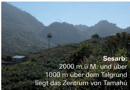
Sesarb: 2000 m.ü.M. und über 1000 m über dem Talgrund liegt das Zentrum von Tamahú

Sesarb liegt mehr als 2000 Meter über Meer und 1000 Meter über dem Talgrund, wo das Zentrum von Tamahú liegt. Die Einwohner begeben sich regelmässig zu Fuss ins Dorf. Mit dem Auto müsste ein mehrstündiger Umweg auf schlechtesten Strassen gefahren werden. Abgesehen davon besitzen die Leute hier gar kein Auto.