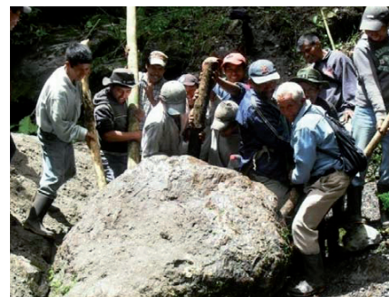
Der Bau einer Wasserversorgung: Sicherstellung des Gelände