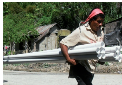
Die gesamte Bevölkerung des Dorfes arbeitet mit

Dank genügend Wasser werden zusätzlich solche Gartenträume wahr. Der Hunger in dieser armen Gegend kann so am wirkungsvollsten bekämpft werden.