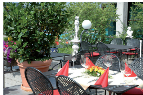
Prächtige Terrasse: Luftig-duftiges Ambiente mit extra neuen soften Sitzkissen

Sie wollen feiern? Das Tägi organisiert gerne alles von A - Z für Sie: Bankette und Caterings