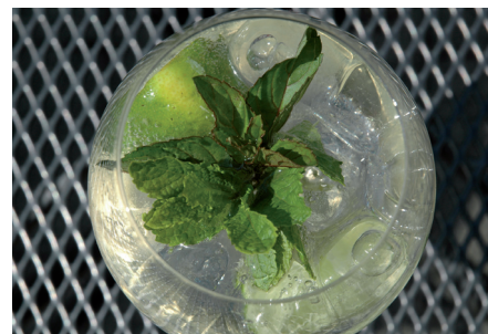
Der Tägi-Spritz: Gekonnt gemixt