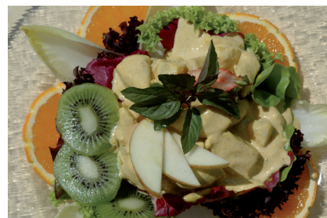
Die sommerliche Karte bietet Abwechslung und immer Spitzenqualität